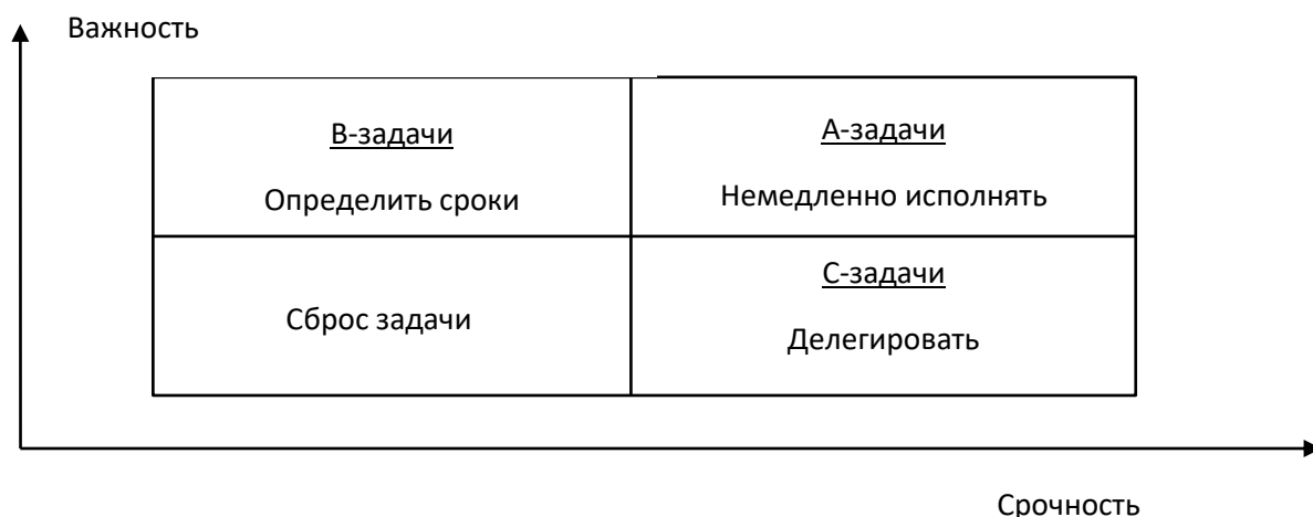
Рисунок 1 – Матрица задач

С-задачи: менее важные, но срочные, решение которых следует делегировать подчиненным.