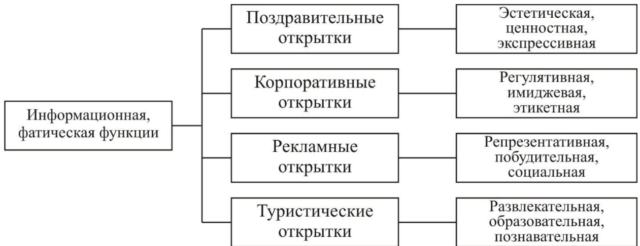
Схема 2. Классификация открыток XX-XXI вв. на основе выполняемых ими коммуникативных функций.

В главе 2 «АНАЛИЗ КОНСТРУКТИВНЫХ ПРИЕМОВ И ТЕХНИК РАБОТЫ С БУМАГОЙ И ИХ ИСПОЛЬЗОВАНИЕ В ФОРМООБРАЗОВАНИИ ХУДОЖЕСТВЕННЫХ ОТКРЫТОК КОНЦА XX – НАЧАЛА XXI ВВ.» рассматриваются основные конструктивно-технологические приемы бумажного формообразования, традиционные (оригами) и современные (pop-up) техники работы с бумагой; выявляются особенности их использования в дизайне открыток начала XXI в.; предпринята попытка провести классификацию открыток на основе использованных приемов динамической трансформации формы.