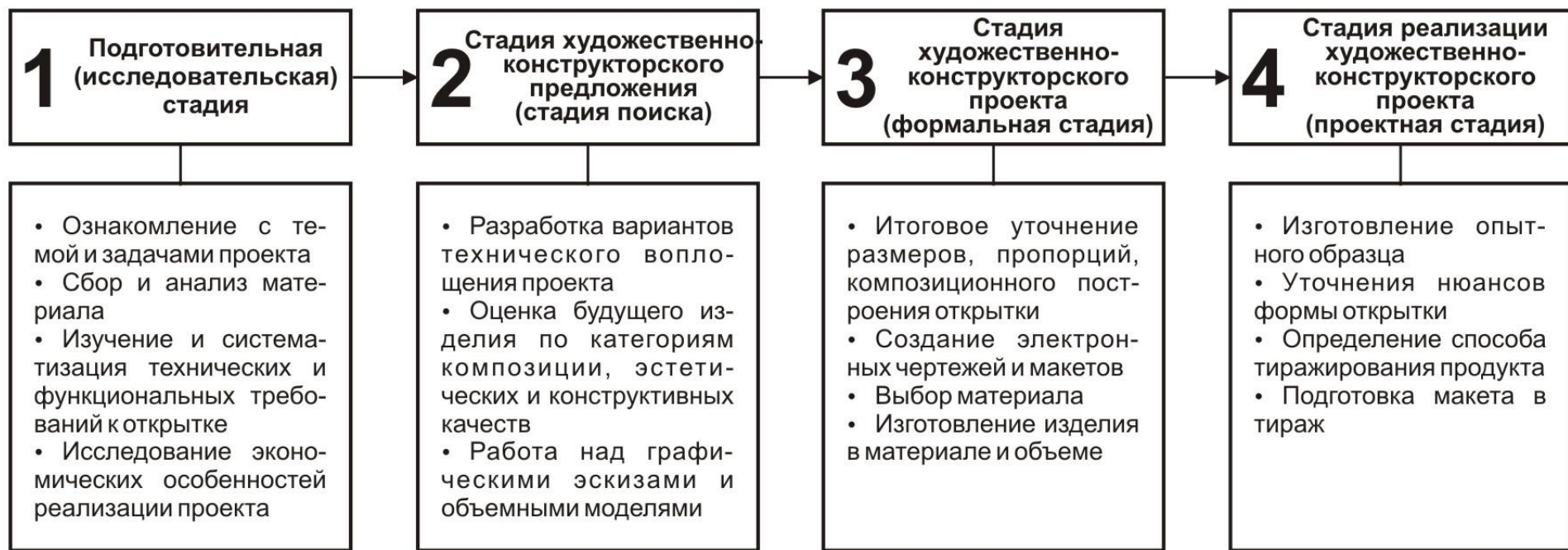
Схема 5. Основные стадии дизайн-проектирования полифункциональной туристической открытки.