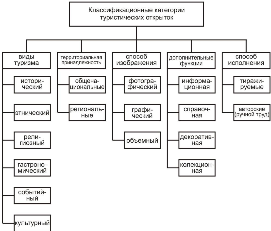
Схема 4. Классификационные категории туристических открыток.

Дизайн туристической открытки основывается на ряде проектных принципов, которые определяются следующими группами: коммуникативной, технологической, эстетической. Коммуникативная группа представлена принципом информативности, принципом индивидуализации, принципом эмотивности и принципом доступности. В состав технологической группы входят принцип целесообразности, принцип тектоничности, принцип трансформации, принцип функционального совмещения. К эстетической группе относятся: принцип образности, этнический принцип, архетипический принцип.