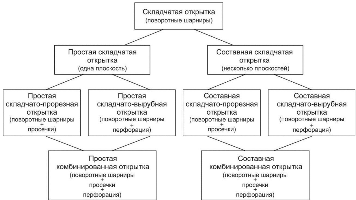
Схема 3. Классификация открыток на основе динамического формообразования.

Глава 3 «ДИЗАЙН-ПРОЕКТИРОВАНИЕ ТУРИСТИЧЕСКИХ ОТКРЫТОК НА ОСНОВЕ АРХИТЕКТУРНОГО ОРИГАМИ И ДИНАМИЧЕСКОЙ ТРАНСФОРМАЦИИ ПЛОСКОСТИ» посвящена изучению туристической открытки начала XXI в.; выявлению особенностей ее дизайна; определению принципов дизайн-проектирования и специфических технологических приемов формообразования данного вида продукции в контексте тенденций современной культуры, а также перспектив развития производства туристических открыток. Предложено определение туристической открытки – это малоформатное художественное полиграфическое издание, отражающее определенное место, время или событие, имеющее эмоциональную связь с личной историей человека и его системой ценностей.