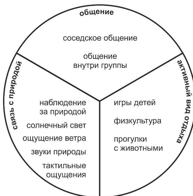
Схема 1 – Компенсирующая функция дворового пространства.

Был выявлен один из основных принципов организации современного дворового пространства – принцип интеграции дворового пространства в среду города. Благодаря этой установке жилой комплекс или целый район не теряет смысловой и физической связи с пространством города (схема 2).