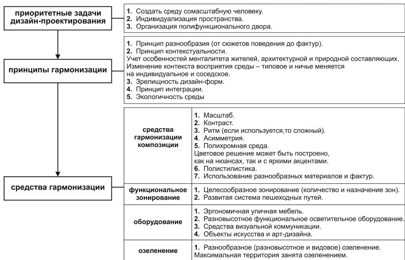
Схема 5 – Гармонизация дворовых пространств в среде многоэтажной жилой застройки 1970-1990-х гг.

тихого отдыха), также во дворе есть отдельное место для личного автотранспорта жильцов. Оборудование использовано типовое и во всех дворах одинаковое. Двор проектировался как пространство для отдыха. Предполагалось, что жить на одном месте человек будет долго, поэтому вокруг дома создавалась среда для полноценного отдыха. Сейчас большинство дворов находится в запустении или используется под автостоянки. Слабо освоен жильцами. Рекомендации по гармонизации дворового пространства в среде многоэтажной типовой застройки представлены в схеме 5.