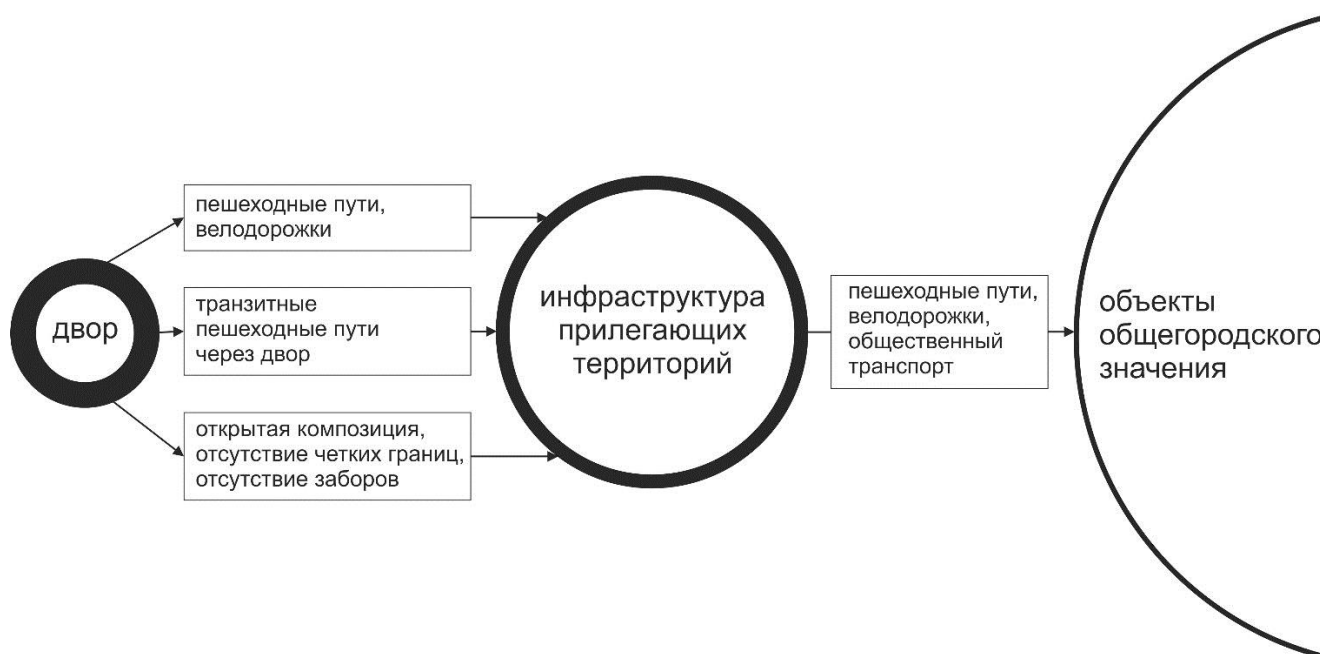
Схема 2 – Интеграция дворового пространства в городскую среду.

Был выявлен один из основных принципов организации современного дворового пространства – принцип интеграции дворового пространства в среду города. Благодаря этой установке жилой комплекс или целый район не теряет смысловой и физической связи с пространством города (схема 2).