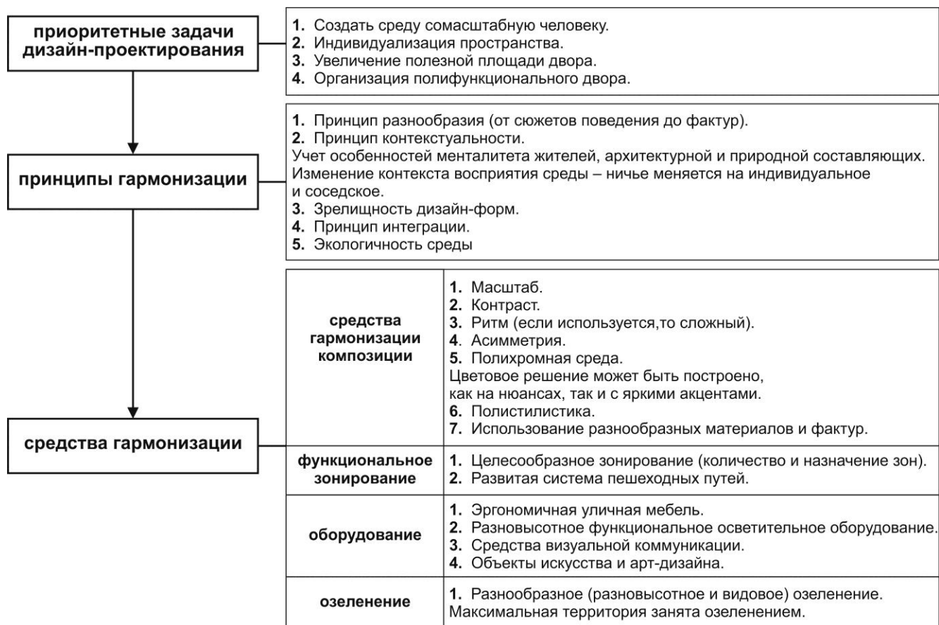
Схема 6 – Гармонизация дворовых пространств в среде многоэтажной современной жилой застройки 2000-2010-х гг.

Рекомендации по гармонизации дворовых пространств в среде современных многоэтажных жилых комплексов представлены в схеме 6.