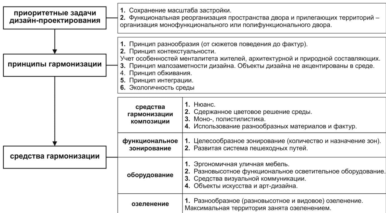
Схема 7 – Гармонизация дворовых пространств в среде малоэтажной жилой застройки 1950-х гг.

Рекомендации по гармонизации дворовых пространств в среде малоэтажной жилой типовой застройки 1950-х гг. представлены в схеме 7.