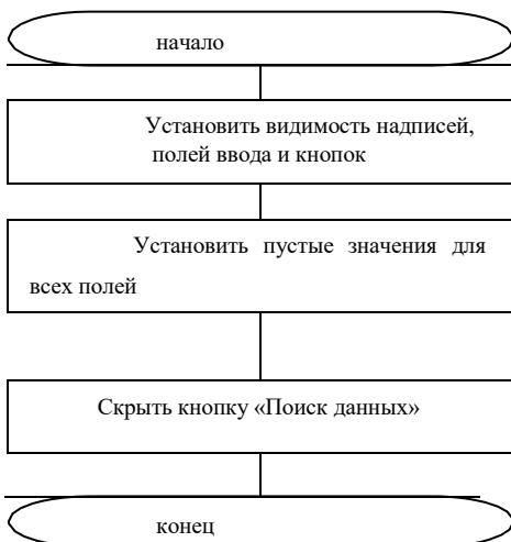
Рис3. Алгоритм метода «Видим ввод»