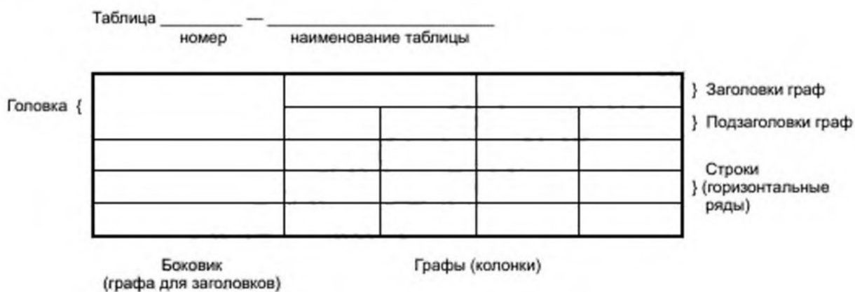
Рисунок 3 – Составные части таблицы

... Результаты расчетов представлены в таблице 4.