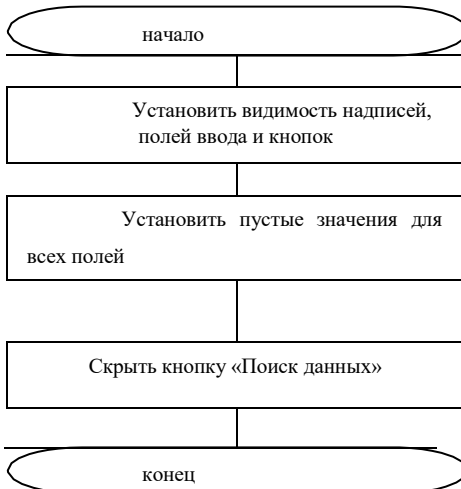
Рис3. Алгоритм метода «Видим ввод»