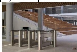
Рисунок 1 – Входная группа школы №220 в центре микрорайона «Евроберег»

архитектор проекта школы в «Евробереге»: «Важная особенность современной школы – ее инклюзивность, готовность к совместному обучению всех детей, независимо от их социального статуса, способностей и особенностей здоровья» [5, с. 59]. Из-за замкнутого прямоугольного контура, который получился в ходе разработки, двор стал многофункциональным атриумом. Вертикальные связи между этажами были организованы в угловых лестницах. Получившаяся планировка создает кольцевые коридоры, которые позволяют избежать тупиков, обеспечить четкую навигацию и предложить разнообразные маршруты вместо линейного движения вверх и вниз (рис. 1) [5, с. 59]. Специализированные классы заменили кластеры – медиа и арт, спортивный, естественно-научный и технологический. Все учебные аудитории имеют кросс-функциональный характер и могут использоваться для изучения нескольких предметов. Их размеры и конфигурация позволяют адаптироваться к различным методикам образовательного процесса: мобильная мебель легко переставляется, что позволяет быстро подготовить класс для традиционного урока, групповой работы, дискуссий или неформальных занятий. Навигация и расположение помещений обеспечивают удобство для детей с нарушениями слуха, зрения или опорно-двигательного аппарата [5, с. 60].