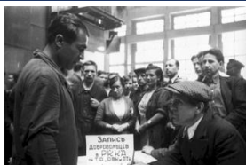
Рисунок 2 – Запись добровольцев ЛЛМЗ на фронт

В 1943 году прадедушка был комиссован по ранению, вернулся домой в Люблино и продолжил работу на заводе. После сокрушительного разгрома немцев на подступах к столице в декабре 1941 года, коллектив завода получил распоряжение: то оборудование, что не успели отправить из столицы, оставить на месте, демонтаж приостановить, монтировать цеха заново. Вопреки всем сложностям военного времени завод ни разу не стоял из-за того, что не хватало топлива, сырья или рабочих рук. «Все для фронта! Все для победы!» – этот лозунг стал смыслом жизни завода.