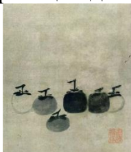
Рисунок 1 – «Шесть плодов хурмы»

Совсем небольшая работа с изображением шести плодов хурмы (рис. 1) считается самой почитаемой из всей живописи для чайной церемонии. Она рассматривается как символическая аллегория стадий чаньского просветления. В учении чань темнота означает мудрость или просветление, а светлое связывается с представлением о невежестве. Отсюда самая черная хурма является центральным, главным элементом и выступает как живописная интерпретация дзэнского наставника.