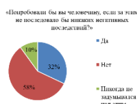
Рисунок 1 – Опрос на тему допустимости каннибализма

не согласились бы даже с учетом того, что никаких негативных последствий не предвиделось, попробовать человеческую плоть (58%), однако сам факт того, что почти треть согласна преступить черту ранее табуированной и в данный момент криминогенной темы, должно настораживать. Человечество, на протяжении сотен лет получающее информацию о недопустимости каннибализма, теперь способно мыслить иначе, отдавая себе отчет в вероятности такого исхода, как акт антропофагии. Это говорит о том, что тема каннибализма не просто перестала быть вне предметности человеческого мировоззрения, но и в перспективе может быть закреплена как возможное действие, чего раньше не наблюдалось у людей без каких-либо отклонений психики.