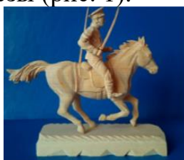
Рисунок 1 – «Донской Казак», автор Сикоренко Т.А., 2024 г.

Основная задача – анализ существующей сувенирной продукции. Целью данной работы является создание сувенирной тематической продукции из древесины. Поскольку резьба по дереву имеет прямое отношение к народным промыслам России, было принято решение создавать сувенирные и выставочные фигурки, связанные с воинской славой Отечества, именно из древесины. Этот материал легко поддается обработке, созданные из него изделия можно как окрасить, так и оставить живую текстуры материала. Одна из таких фигурок – это «Донской Казак» выполненный из древесины березы (рис. 1).