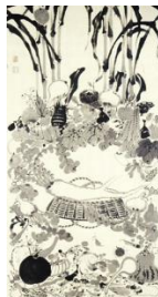
Рисунок 2 – «Овощная паринирвана»

например, как вот этот свиток, который называется «Овощная паринирвана» (рис. 2) и написан японским художником. Будда в виде дайкона, окруженный, как и полагается, по традиционной иконографии, безутешными учениками, другими созданиями, напоминая на самом деле адепту дзена или нам, обычным зрителям, что природа Будды есть везде и всюду. И таким образом, любые предметы и любой, в принципе, сюжет, может стать дополнительным стимулом к пробуждению, чего и стремились достичь многие художники школы Чань.