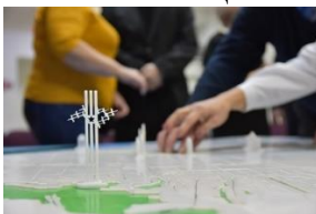
Рисунок 2 – Выставка для слабовидящих людей в Саратовской библиотеке

инклюзивный фестиваль. Недавно музей запустил видеокурс об импрессионизме для глухих и слабослышащих людей.