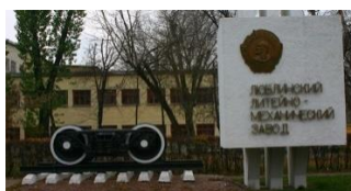
Рисунок 3 – ЛЛМЗ в наше время

Начинался новый этап в жизни завода МОЖЕРЕЗ, который вскоре будет переименован в Люблинский литейно-механический завод (фото рис. 3).