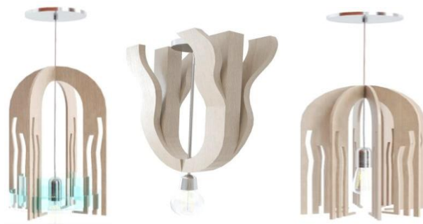
Рисунок 2 – Подвесные светильники