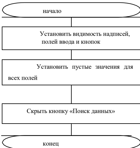
Рис3. Алгоритм метода «Видим ввод»